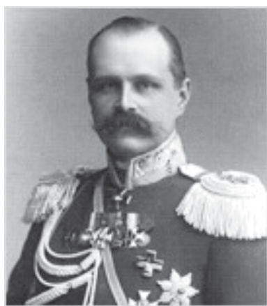
Московский губернатор В. Ф. Джунковский. 1905 г.

На первом собрании, сразу после утверждения Устава, было собрано 400 рублей. Но все равно средств было очень мало.