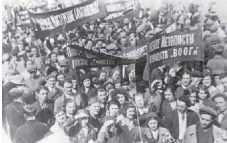
1 мая 1931 г. Колонна ВОГ на демонстрации. Москва

На 1-й конференции МООВОГ 23 января 1930 г. обсуждалось плохое отношение КООПИНСОЮЗа к артелям глухонемых, которых объединяют с другими инвалидами, и работники начинают получать половину того, что прежде (вместо 100 руб. — 50 руб. и т.д.). Было принято решение: часть имевшихся артелей реформировать в УПМ. А квалифицированных рабочих направить на промышленные предприятия.