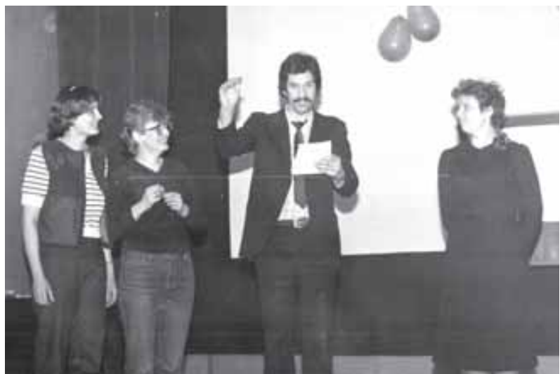
70-80-е годы. Молодежный клуб «Юность»