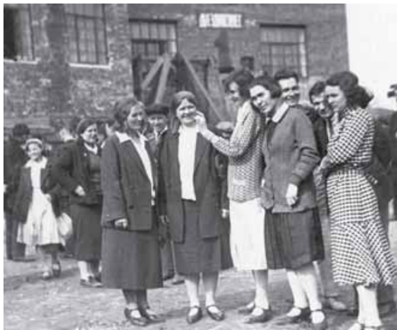
Начало 30-х гг. На открытии УПМ на ул. Кирова

В 1932 г. Всероссийское объединение глухонемых ВОГ — переименовали во Всероссийское общество глухонемых .