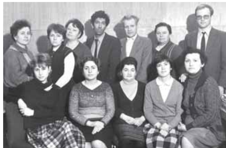
1986 г. Сотрудники Аппарата МГП ВОГ

Уже несколько лет МГО ВОГ совместно с ЦП ВОГ добивается во всех инстанциях, вплоть до Гос-