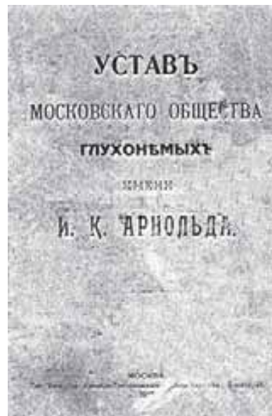
Первый устав Московского общества глухонемых

Московское общество им. Арнольда просуществовало до августа 1918 года, когда на общем собрании было решено объединить его с Московским Комитетом глухонемых под названием Московский отдел ВСГ .