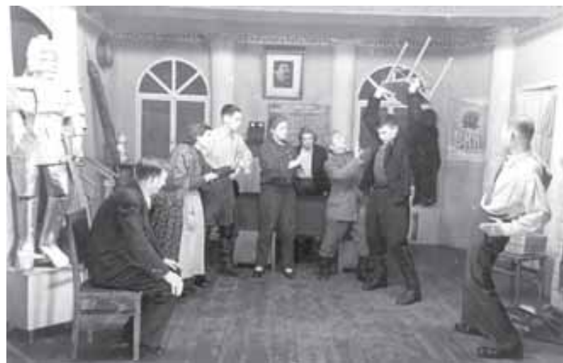
1952 г. Спектакль «Шестеро любимых» в ДК на ул. Хмелева

На деле же для обещанных кружков не нашлось места. Все, что анонсировалось заранее, постепенно исчезло, но это — было потом. А пока москвичи полагали, что в дополнение к прежнему — обжитому и уютному помещению на ул. Хмелева, у них прибавился и этот новый и нарядный большой дворец, в который ездить далеко и не всем удобно, но... изредка — можно. Так что москвичи, как теперь выражаются, «особо не парились»: стали называть ДК на Хмелева — старый, а на Первомайской — новый ДК.