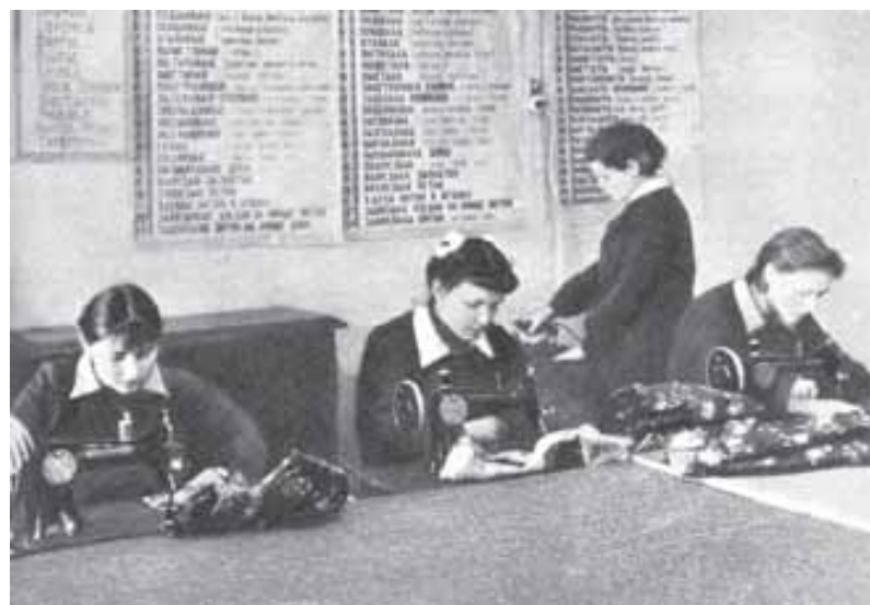
50-е годы. Урок труда в школе глухих. Москва

Были там и занятия по чтению с губ в первичке «губистов», куда в первые годы работы ДК потянулись оплохшие инвалиды войны.