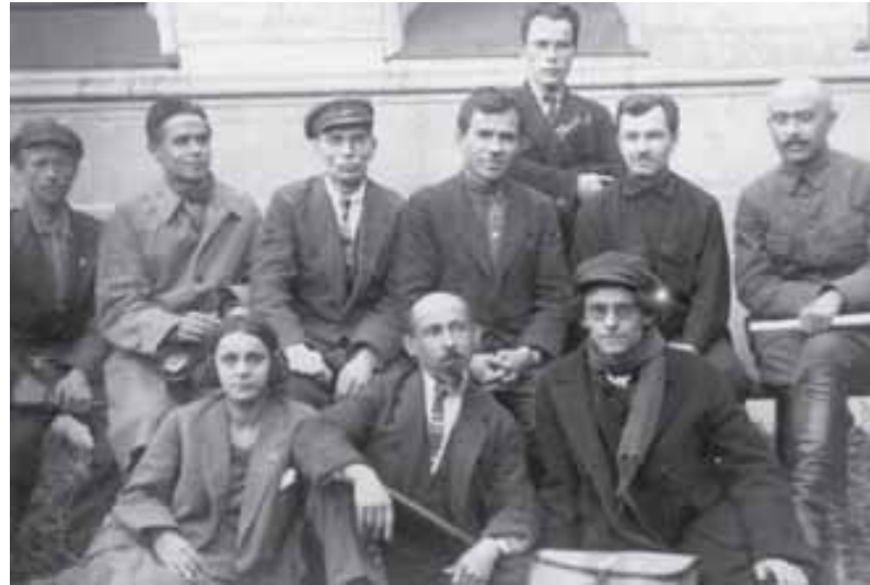
1926 г. Делегаты 1-го съезда ВОГ