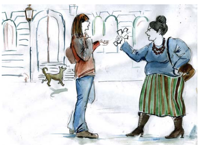
Рисунок Юлии Теслер (С.-Петербург)