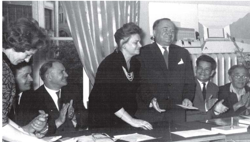
П. Сутягин, первый режиссер Театральной студии №1 Т. Дударова, ректор «Щуки», народный артист СССР Б. Захава, первый председатель ЦП ВОГ П. Савельев на торжественной церемонии первого выпуска артистов театральной студии при ЦП ВОГ

А какие «голубые огоньки» и новогодние праздники мы устраивали! Как счастливы были люди, получая бесплатные билеты на все наши мероприятия. Ведь не было тог-