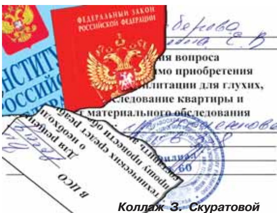
Коллаж З. Скуратовой

п.5. Бюро выполняет следующие функции: а) проводит освидетельствование граждан для установления структуры и степени ограничения жизнедеятельности (в том числе степени ограничения способности к трудовой деятельности) и их реабилитационного потенциала;