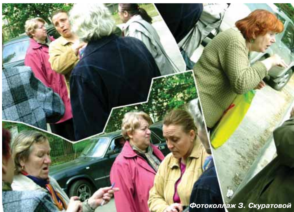
Фотоколлаж З. Скуратовой

Первое судебное слушание шло с 11.00 до 18.30 с одним получасовым перерывом. За столь длительное время из десяти человек успели допросить только семь. Почему не успели заслушать остальных?