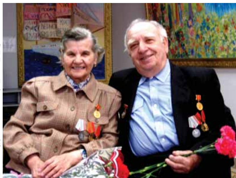
Супруги Гольдины в ЦСО «Орехово-Борисово Северное»

Спуститесь в метро, посмотрите себе под ноги: решетки для чистки обуви от