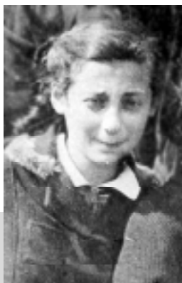
1945 г. Мне 14 лет.