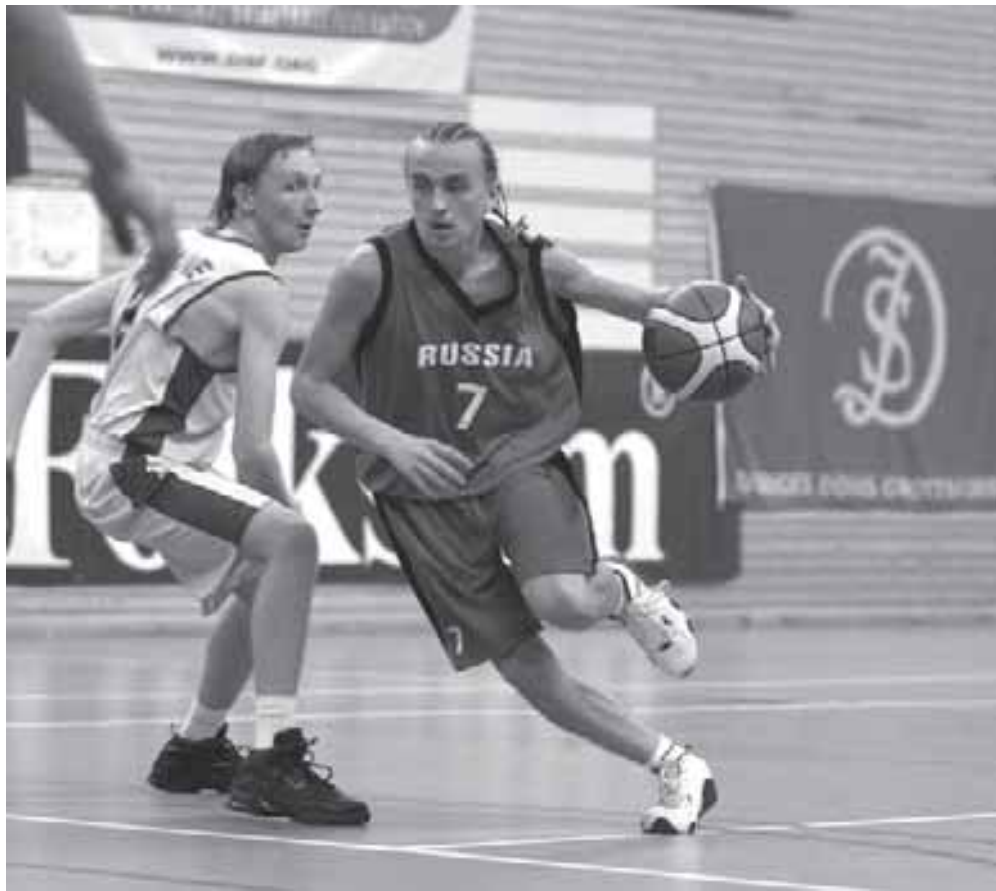
...и не остановишь рывок нашего нападающего

россиянки – серебряные призеры, а украинки на 3 месте. Команды Швеции и Эстонии на 5 и 6 местах соответственно.