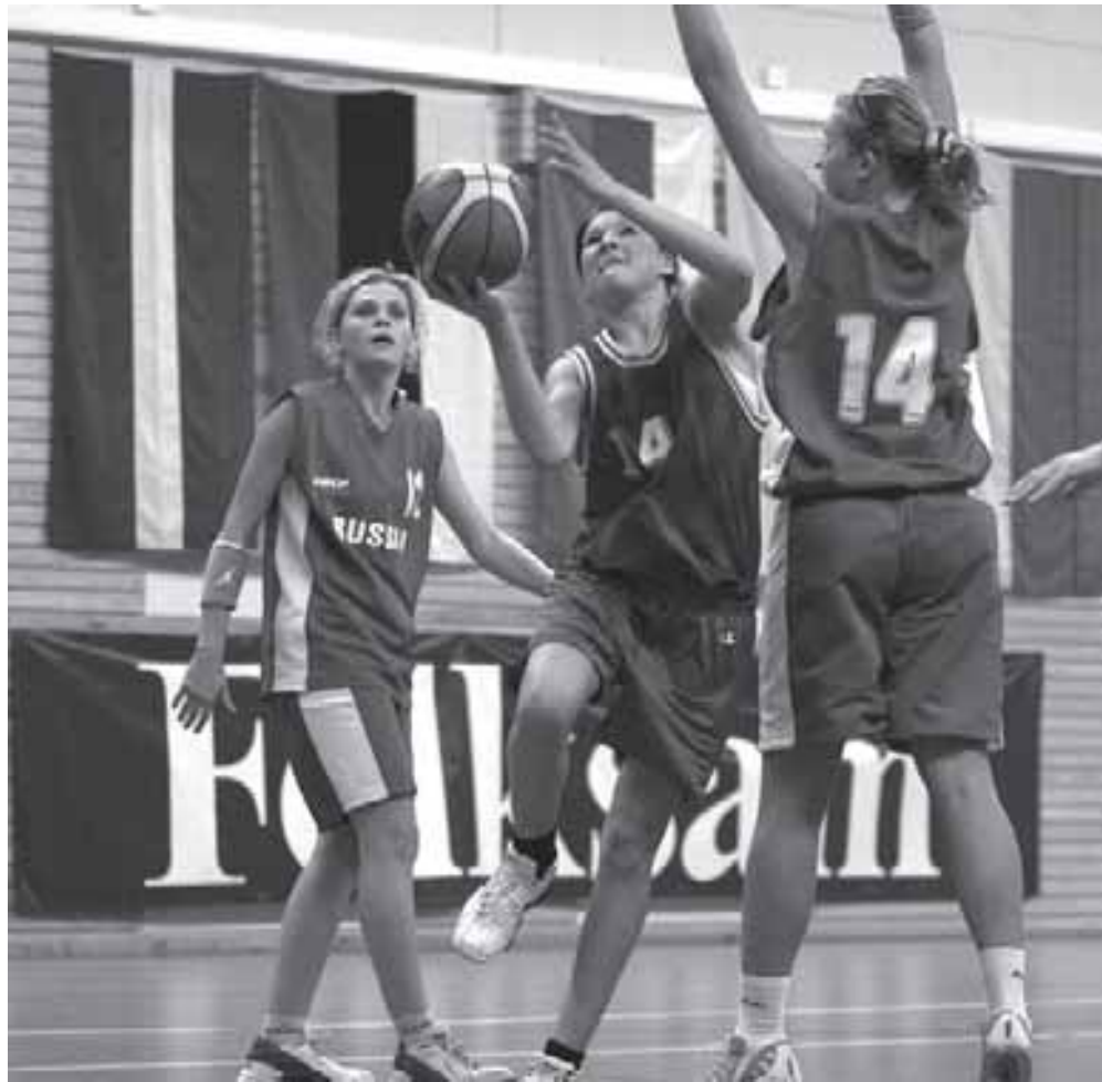
Здесь ничего не поделаешь: не выбросишь мяч обратно из сетки...

Своих соперников по мастерству превосходили юноши и девушки Литвы и России. И поэтому в финале встретились они. Удача была на стороне литовцев.