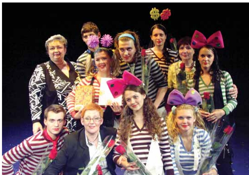
Неслышащие клоуны из школы-студии-театра «Индиго» (г. Томск)

Хотелось бы упомянуть «Муху-Цокотуху», танцевально-цирковой студии «Арлекин»,