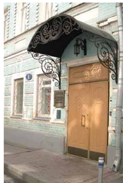
Кроме собственного флага, у МГО ВОГ есть логотип, созданный художником Александром Мартыновым в 1999 году.

Впервые в истории У Московской городской организации ВОГ появился свой флаг, который был изготовлен по специальному заказу в московской фирме «Дельфин».