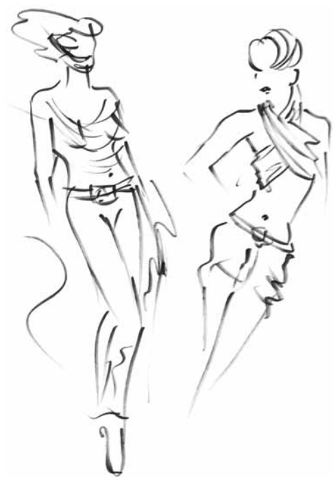
Модели одежды, предложенные Зиной Бебеш

Заказы бывают самыми разнообразными — от шуб и пальто до шляп, платьев и костюмов — Зина все может и умеет. Кроме этого, она иногда помогает своим опытом дочери Ноне, которая пошла по стопам своей мамы