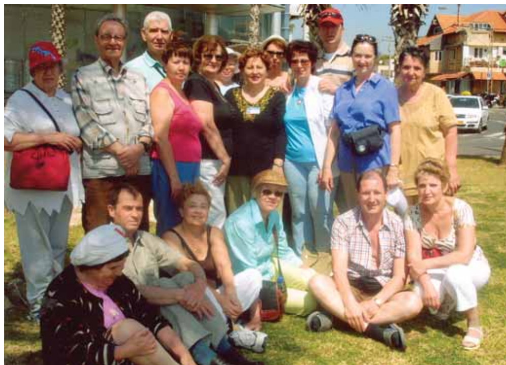
Наша группа глухих на земле Обетованной

По такой «мимозной» дороге мы попали в Иерусалим Христианский. Там находятся знаменитые на весь мир Храм Гроба Господня и Стена Плача.