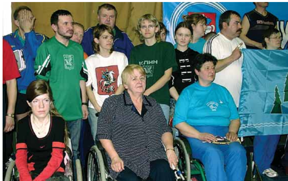
Глухие и колясочники вместе!