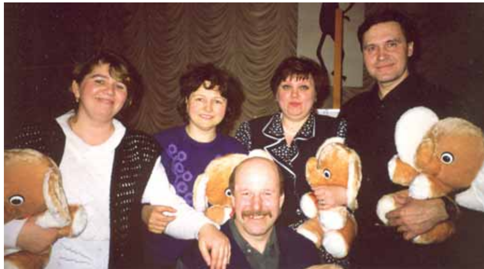
Непобедимая команда «Звезды Москвы»

И как сам говорит, благодаря этому конкур-су, запоминает и понимает значение посло-виц. Например, в одном из туров игры было задание нарисовать пословицу: «В чужой мо-настырь со своим уставом не ходят».