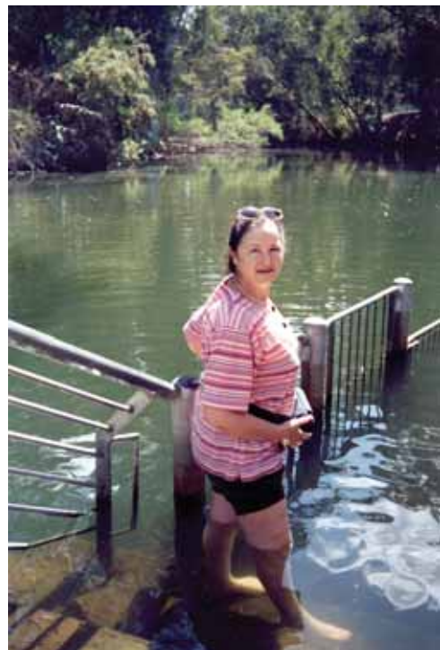
В этом месте крестился Христос