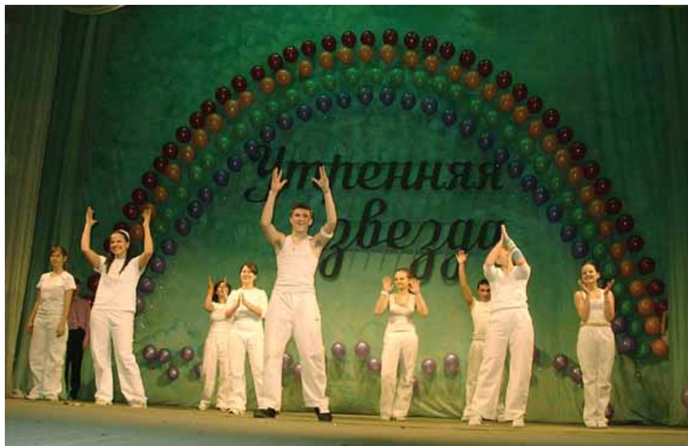
Ребята только что узнали, что заняли 1-ое место за танец «Хип-хоп»

Третьи места разделили между собой танцы: «Вальс-приглашение» (УВК № 1635), красочные «Тарантелла» и «Коррида» (101-ая школа).