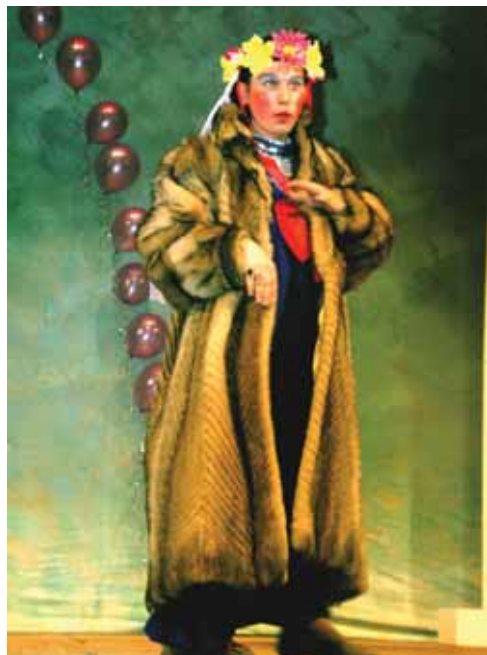
Вера Сердючка (С. Семененко)

Сценарий был незатейливо прост: все подавалось под соусом отбора участников на международный конкурс. Каждый желающий якобы должен был показать свой номер, и ему за это якобы присуждали баллы.